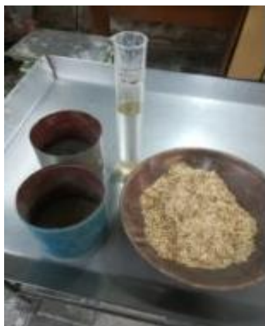
Компоненты для приготовления

2. Костробетон - бетон, в котором в качестве заполнителя используют органические материалы растительного происхождения. Исследуется возможность применения отходов переработки льна в строительных материалах.