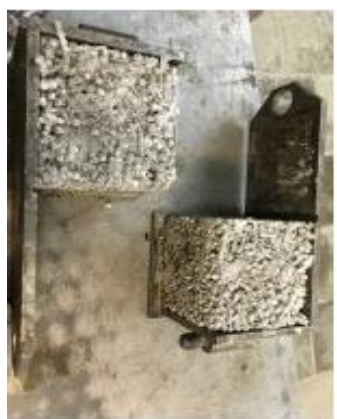
Образцы 10x10x10 полистиролфибробетона

1. Полистиролфибробетон – исследуется возможность и оценивается целесообразность применения фибры из ПЭТ тары для улучшения свойств полистиролбетона, рассматривается возможность и методика промышленного получения данного материала. По данной теме подан патент «Фибра из ПЭТ тары для полистиролфибробетона» рег. № 2019124608.