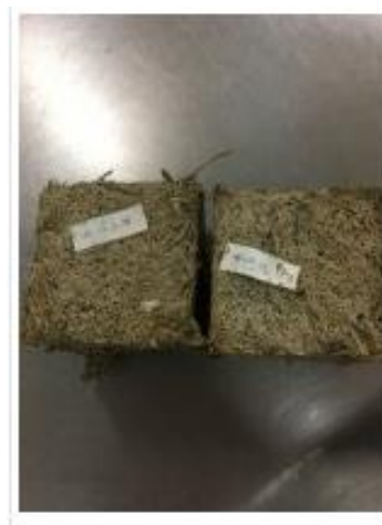
Образцы 10x10x10 костробетона