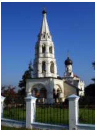
Храм Рождества Пресвятой Богородицы.

Издавна в Поярково существовала легенда, что 16-летний Пётр, будущий первый русский император, венчался здесь в храме Рождества Пресвятой Богородицы 27 января 1689 году с Евдокией Лопухиной. Этот брак был заключён в угоду матери Петра, которая желала показать политическим противникам, что её сын достаточно взрослый, чтобы взять власть в свои руки.